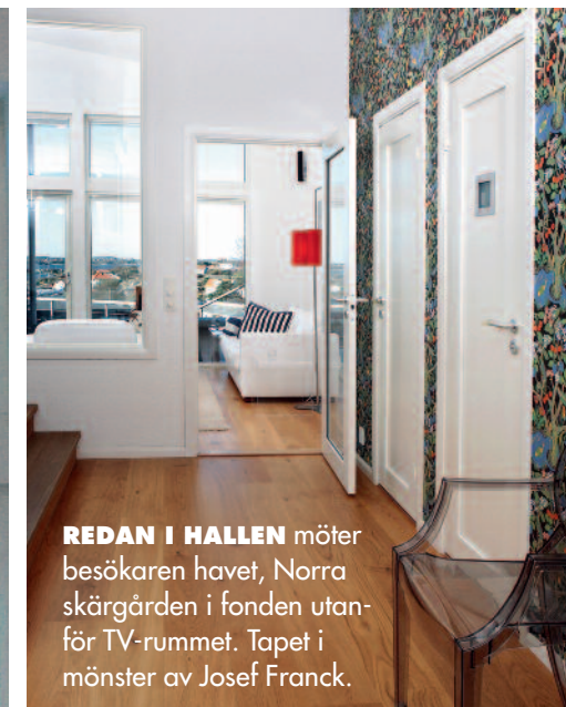
REDAN I HALLEN möter besökaren havet, Norra skärgården i fondon utanför TV-rummet. Tapet i mönster av Josef Franck.

– Fina fartyg och hav runt om i världen är en fantastisk arbetsplats. Men en sak är säker: Borta bra men hemma bäst! ●