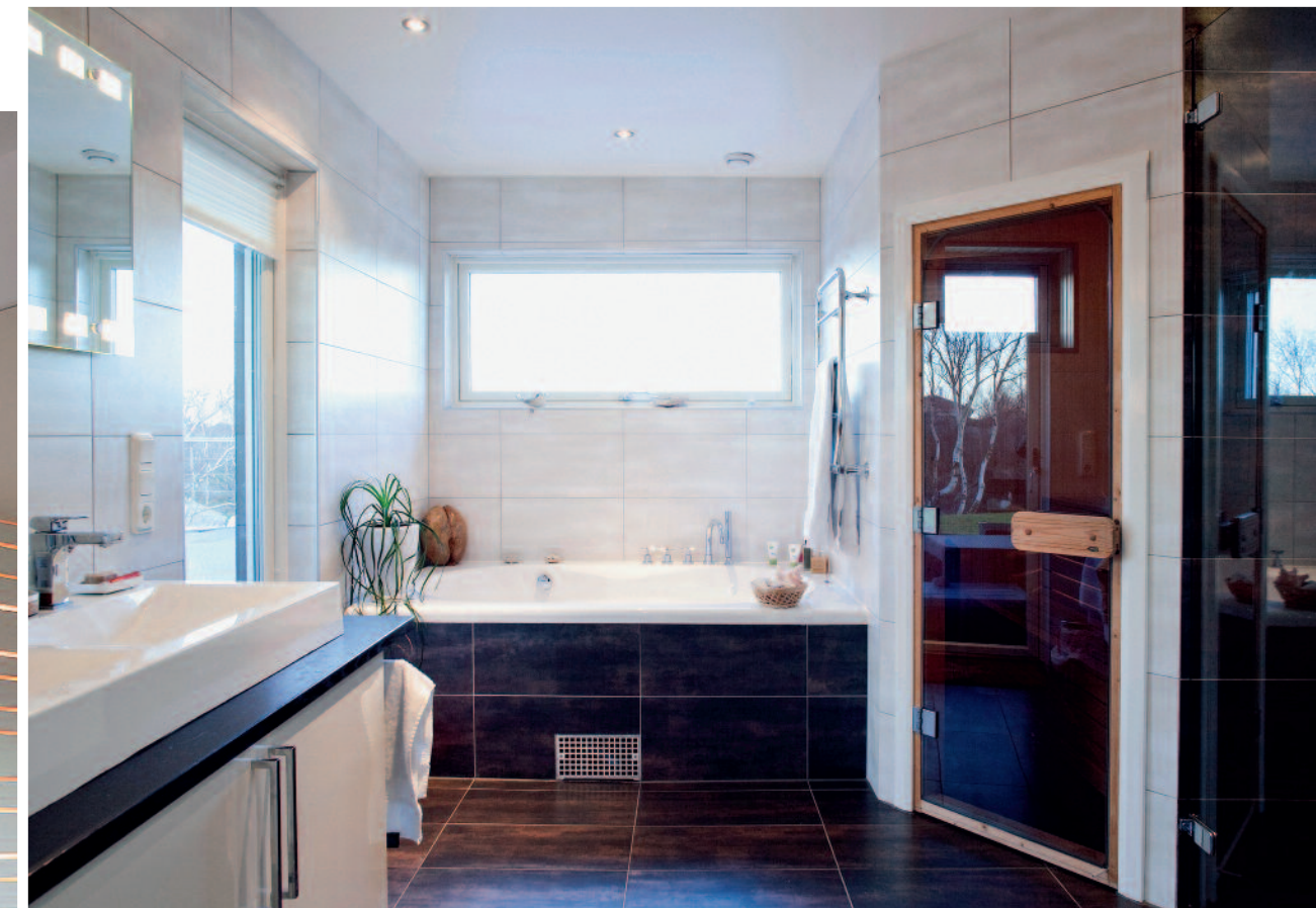
HÄRLIGT TILLTAGET föräldrabadrum med bastu och via dörren och några steg är man ute vid poolen.

” Husets konstruktion var rätt komplicerad. Det är många vinklar och hörn som ska stämma och då planlösningen är öppen i husets mittersta del är det rejäla spännvidder som ska bäras upp.