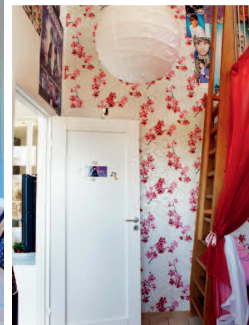
DEN ENDA som lades till från grundritningen under bygget var ett sovloft i dotters rum, eftersom höjden på rummet var så generöst tilltagen.