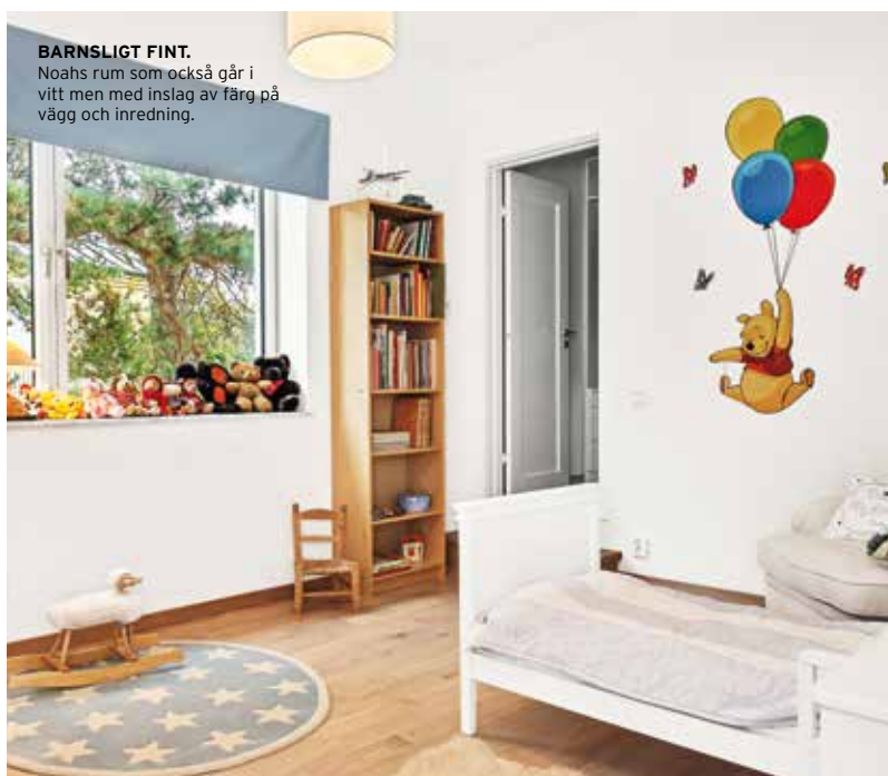
BARNSLIGT FINT. Noahs rum som också går i vitt men med inslag av färg på vägg och inredning.