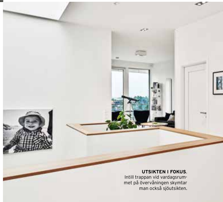
UTSIKTEN I FOKUS. Intill trappan vid vardagsrum- met på övervåningen skymtar man också sjöutsikten.