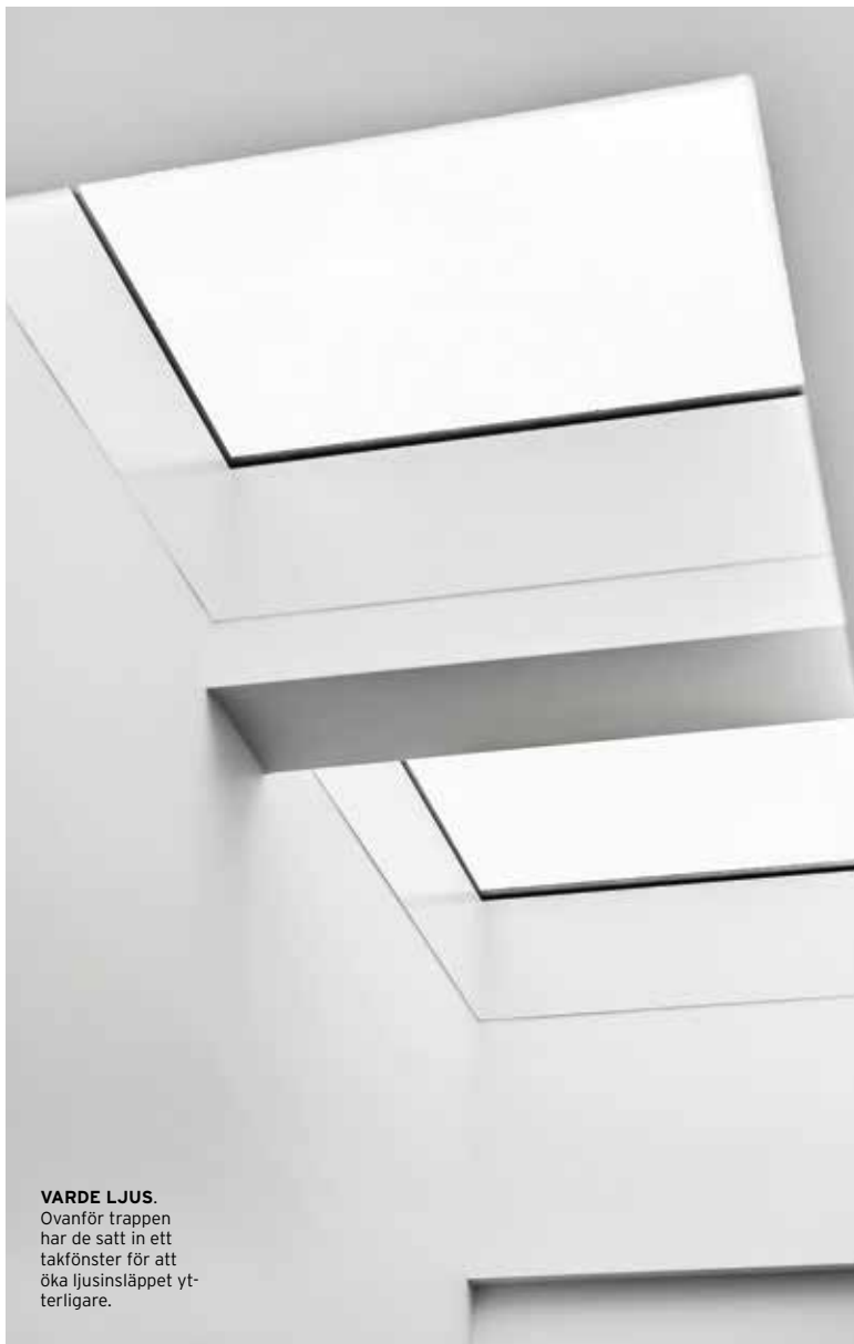
VARDE LJUS. Ovanför trappen har de satt in ett takfönster för att öka ljusläppet yt- terligare.

”...VI BEHÖVDE EN HUSLEVERANTÖR SOM KUNDE GÖRA ALLT.”