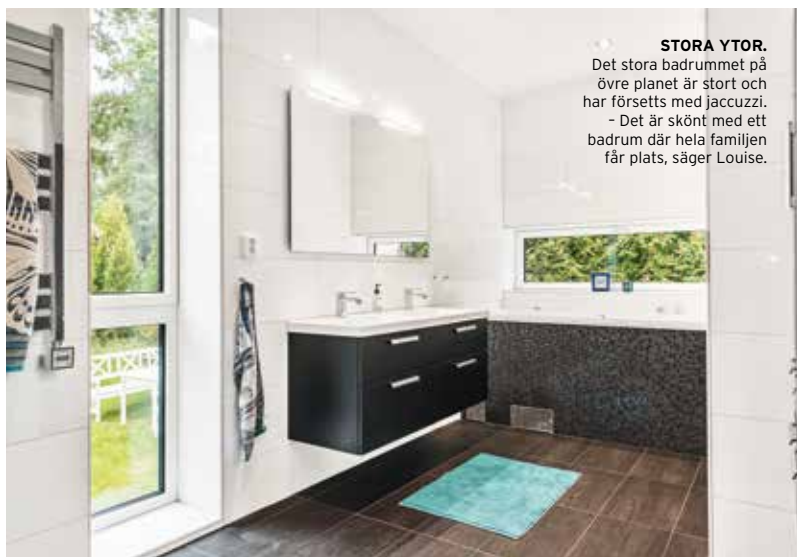
STORA YTOR. Det stora badrummet på övre planet är stort och har försetts med jacuzzi. - Det är skönt med ett badrum där hela familjen får plats, säger Louise.