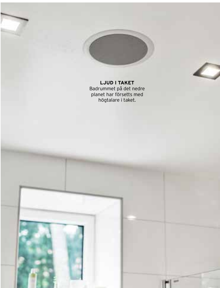
LJUD I TAKET Badrummet på det nedre planet har försetts med högtalare i taket.