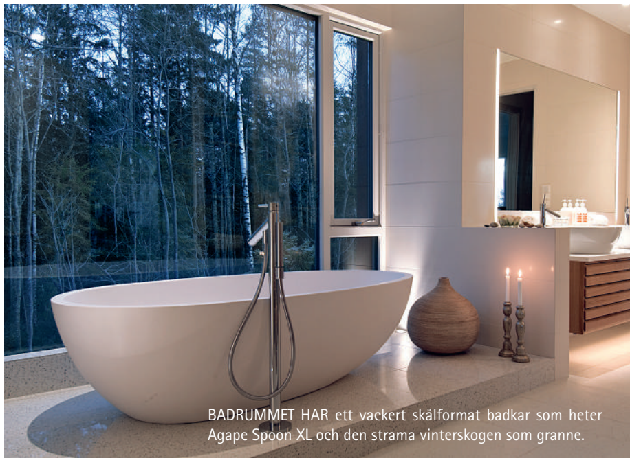
BADRUMMET HAR ett vackert skålformat badkar som heter Agape Spoon XL och den strama vinterskogen som granne.