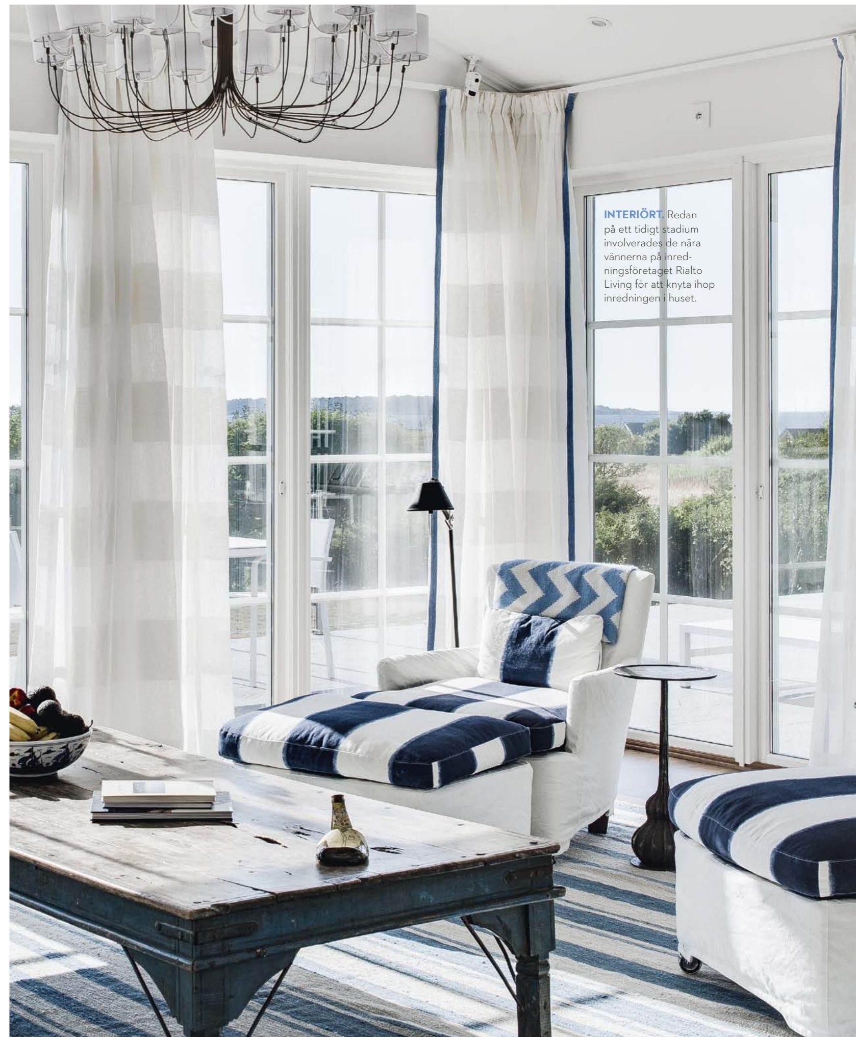
INTERIÖRT. Redan på ett tidigt stadium involverades de nära vännerna på inredningsföretaget Rialto Living för att knyta ihop inredningen i huset.