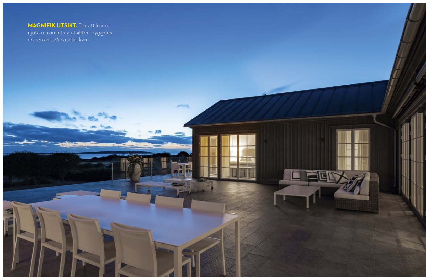
MAGNIFIK UTSIKT. För att kunna njuta maximalt av utsikten byggdes en terrass på ca 200 kvm.